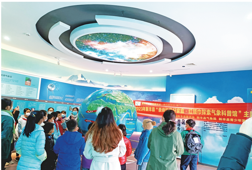
▲ 2023年1月16日，新丰县气象局联合共青团新丰委员会、青少年宫开展“崇尚科学好家庭·红领巾探索气象科普馆”主题实践活动