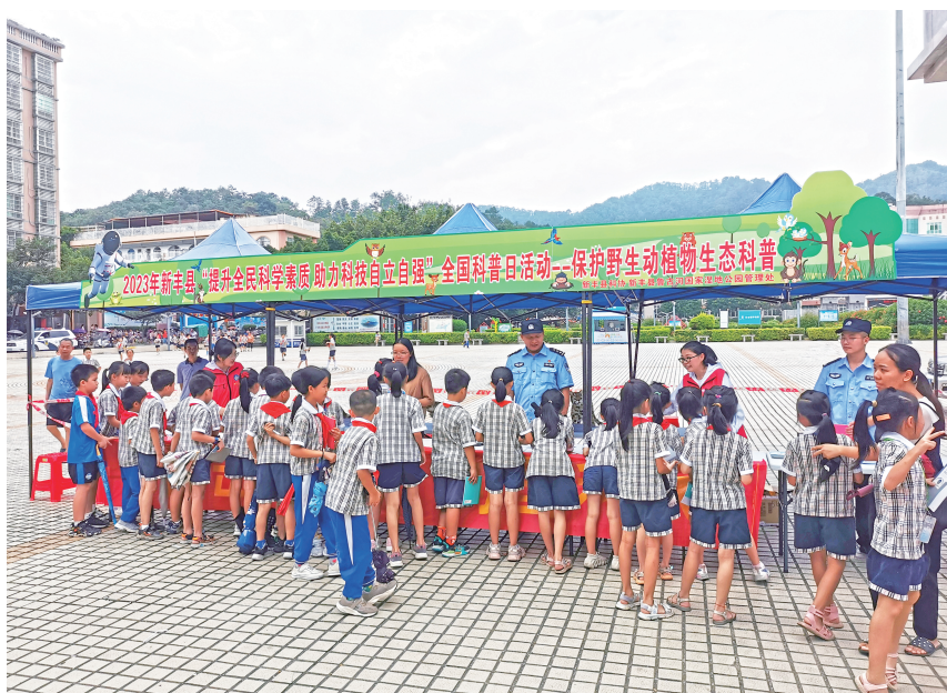
▲ 2023 年 9 月 22 日，新丰县开展“提升全民科学素质 助力科技自立自强”全国科普日活动