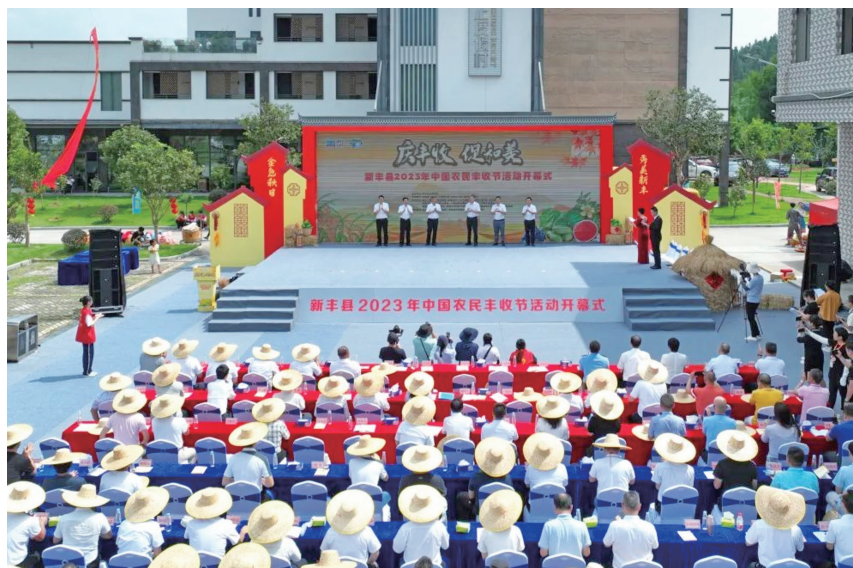
▲ 2023年9月23日，以“庆丰收 促和美”为主题的新丰县庆祝“中国农民丰收节”活动在黄磜镇雪峒村举办