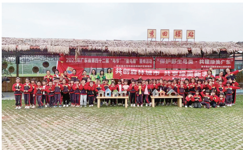
▲ 2023 年 3 月，广东新丰鲁古河国家湿地公园管理处在马头镇秀田村开展“鸟节”“爱鸟周”宣传活动

【科普宣教工作】 2023 年，广东新丰鲁古河国家湿地公园管理处结合“世界湿地日”“世界野生动植物保护日”“爱鸟周”“全国科普日”“保护野