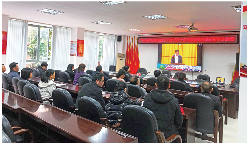
▲ 2023 年 12 月，新丰县工信局组织辖区规模以上工业企业参加“广东省‘降低制造业成本十条’‘技改十条’政策宣讲培训会”