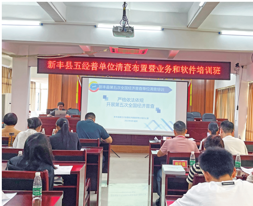
▲ 2023年8月11日，新丰县统计局开展第五次全国经济普查清查培训

【统计法治建设】 2023年，新丰县统计局加强统计执法力度，夯实统计基础建设。开展统计执法检查，按照《韶关市统计执法大检查实施方案》的文件精神，对辖区内的部分“四上”企业进行执法检查，加强企业基础建设和统计数据质量；加强镇（街）统计基础建设，要求各镇（街）按“五有七化”要求，完善镇（街）统计基础建设；规范“四上”企业统计基础建设，联网直报