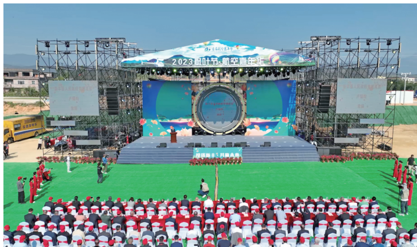
▲ 2023 年 11 月 24 日，第十七届枫叶节（航空嘉年华）活动暨招商大会在新丰县举办

村 4G 信号覆盖率 100%，20 户以上自然村光纤网络覆盖率 100%。新丰移动 4G 基站 625