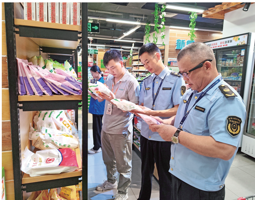
▲ 2023年8月11日，开展食品抽检活动