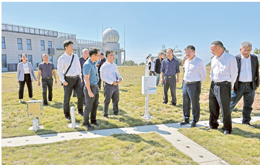
▲ 2023年10月24日，广东省气象局党组书记、局长庄旭东，韶关市政府副市长李再丰，县委书记郑伟平、副县长谢金宏一行调研新丰国家大气本底站业务运行工作

【农村防雷安全和气象服务，助力乡村振兴】 2023年，“新丰县马头镇、黄礞镇、遥田镇村委办公楼和镇客运站防雷装置更新完善服务项目”在新丰县人民政府第十六届三十四次常务会和县委十四届第70次常委会予以通过，资金以2023年珠三角对口帮扶韶关市驻镇帮镇扶村资金予以保障，年内顺利完成马头镇、黄礞镇、遥田镇43栋村委办公楼和回龙镇客运站的雷电防护装置更新完善工作，提升基层防灾减灾能力，解决城乡防雷减灾发展不平衡问题，助力乡村振兴，保障人民生命和财产安全。