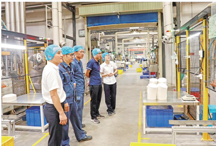
▲ 2023年7月12日，新丰供电局电力护航企业高质量发展

2023年，提质增效不断发力，促成政府联合印发电能替代实施方案，32个项目落实落地，指标完成率291%，全市最高；替代电量619万千瓦时，完成激励目标137%。第三监管周期电网输配电价政策平稳推进，电费回收率100%。资产全生命周期管理基础扎实，固定资产项目转固率、增资完成率均达标。逆向物资提质增效，闲置物资再利用总额达186.69万元，报废处置回收资金71万元。大力支持公司战略新兴业务发展，供应链金融支持规模为1232万元，完成率187%。高质量推进审计发现问题整改，配合完成主要负责人任中审计，整改问题